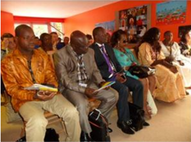
Que du beau monde !